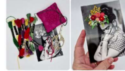
Workshop: STICKEN AUF FOTOGRAFIE (Frida Kahlo)