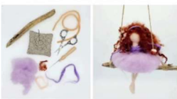
Workshop Nadelfilzen: FRÜHLINGSFEE