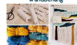
Workshop MacraWeave: MAKRAMEE TRIFFT WEBEN Wandbehang