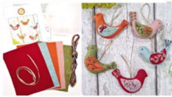
Workshop Sticken: BUNTE VÖGELIS