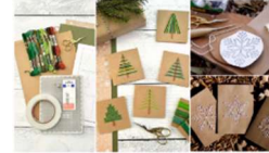
Workshop Sticken auf Papier WEIHNACHTSKARTEN