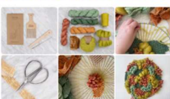
Workshop Weben: FARBEN & TEXTUR IM KREIS