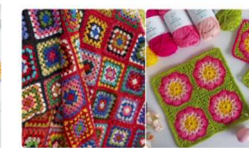
Workshop Häkeln: GRANNY SQUARES Zauber