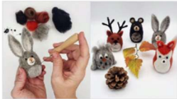
Workshop Nadelfilzen: SÜSSE TIERCHEN