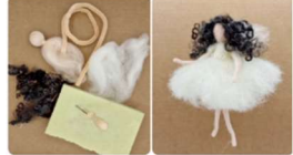
Workshop NADELFILZEN: Engelchen