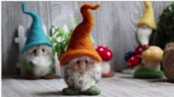
Workshop Nadelfilzen: FRÜHLINGSZWERGE