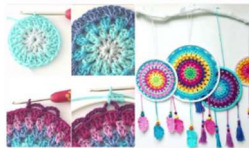
Workshop Häkeln: MANDALA TRAUMFÄNGER